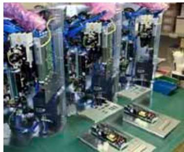
各種ユニット組立