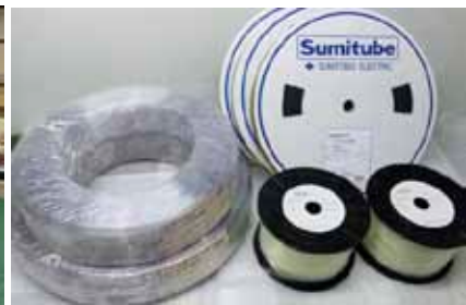
チューブ等切断素材