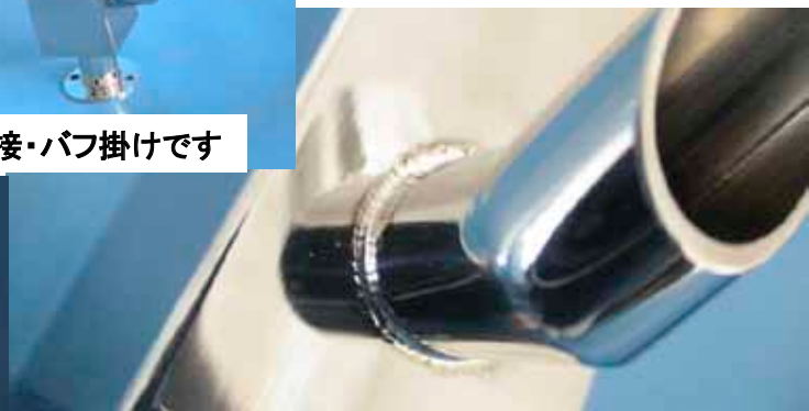
筒部分もこのように仕上がります