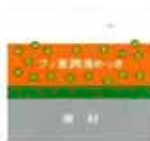
断面図 ● PTFE